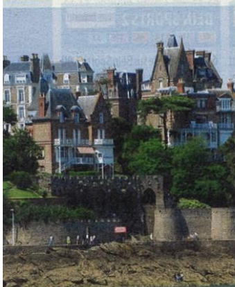
Manoirs de bord de mer et anciens hôtels Art déco témoignent du passé prestigieux de Dinard.

D'abord les longues plages de la station familiale de Saint-Cast-le-Guildo, puis le cap d'Erquy. Bienvenue dans les Côtes-d'Armor ! Au fil du GR 34 qui traverse la lande fleurie d'ajoncs et de bruyères, la vue sur la baie de Saint-Brieuc fait chavirer les Breizh lovers . Les plis des falaises cachent des criques solitaires ; à leur sommet, on tombe sur d'étranges