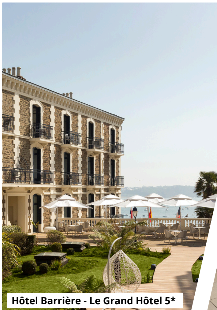
Hôtel Barrière - Le Grand Hôtel 5*