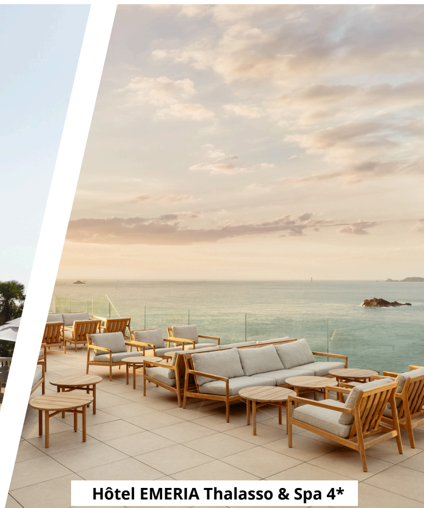
Hôtel EMERIA Thalasso & Spa 4*